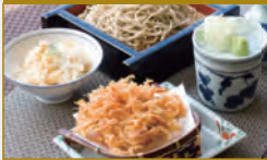
桜海老の揚げそば