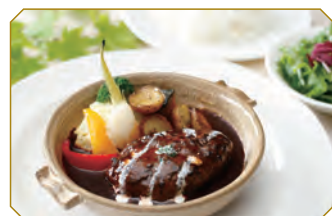
国産和牛ハンバーグ季節野菜添え