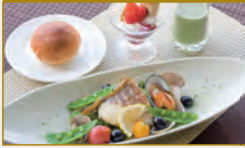
鯛と春野菜のアクアパッツァ