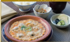
はまぐりの陶板御膳