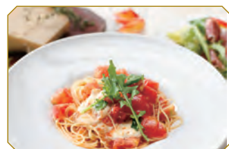
モッツアレラチーズとトマトの Pasta