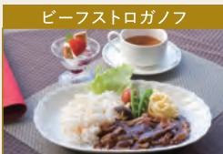
ビーフストロガノフ