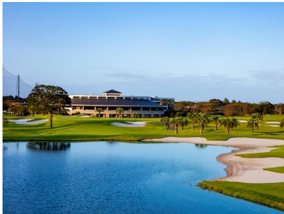
ザ・ロイヤルゴルフクラブ No.9