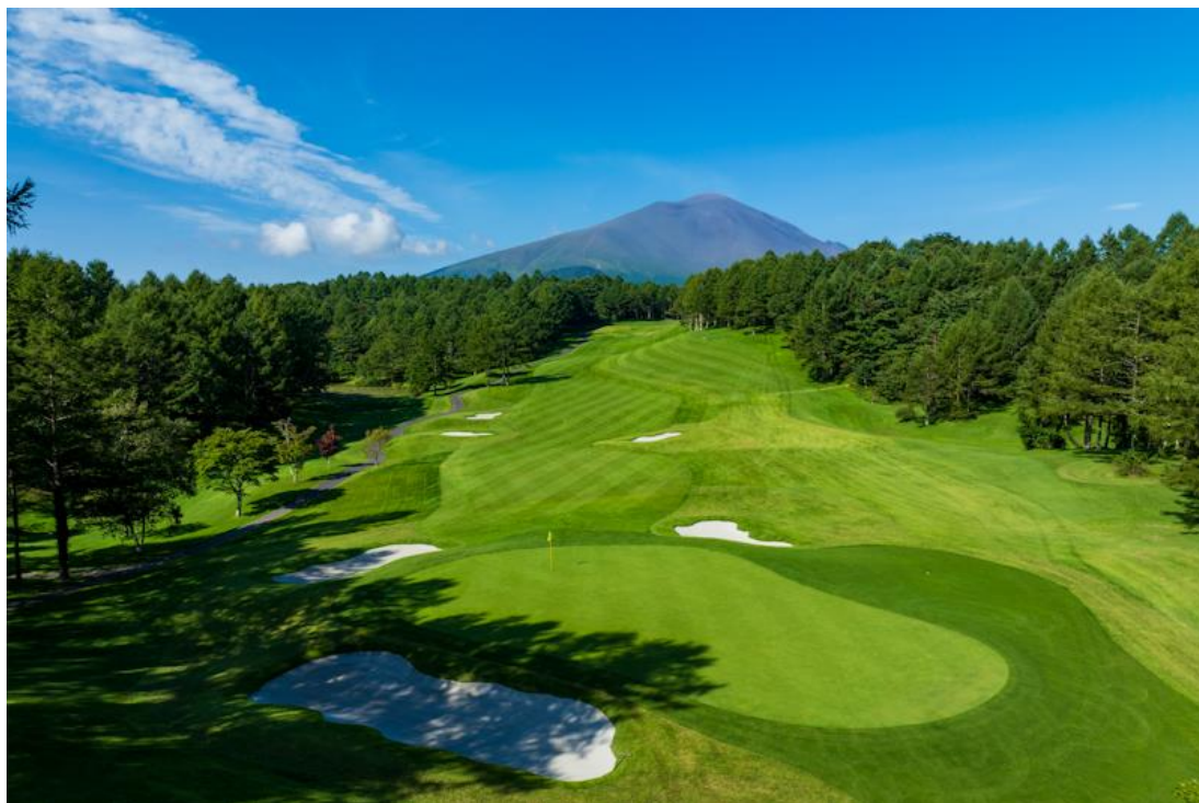
浅間コース 18番ホール

ベスパージ・ブラックコース / コングレッショナル CC / トーリーパインズ / ザ・カントリー・クラブ / バルタスロール GC / アトランタアスレチッククラブ / ハイゼルティン・ナショナルゴルフクラブ / メダイナ CC #3 など