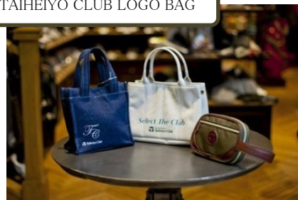
TAIHEIYO CLUB LOGO BAG