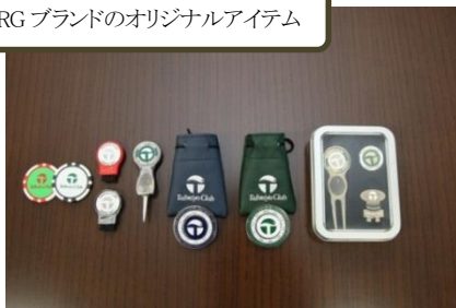
PRG ブランドのオリジナルアイテム

“PRG”ブランドは今回が日本初上陸となり、国内では御殿場コース、御殿場ウエストでしか入手できません。この他、日本で入手するのが困難なブランドのアイテムが展開されています。ゴルフ仲間と差がつく、お気に入りのアイテムがきっと見つかります。