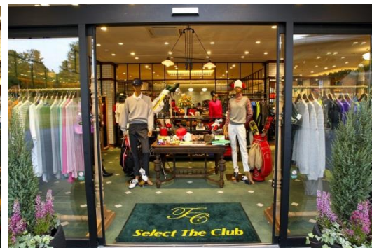
"Select The Club Gotemba" (上)外観 (左下)メンズコーナー (右下)エントランス