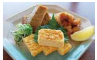
おまかせ三種盛り ¥1,000