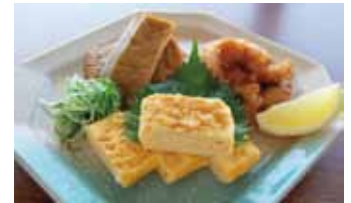
Appetizers. 3 kinds ¥1,000