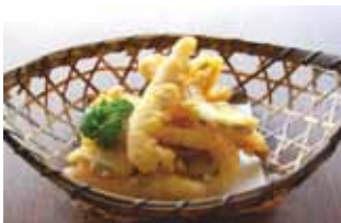
Salted Squid tempura