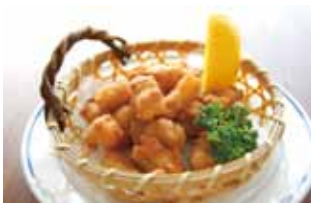
Fried Chicken cartilage