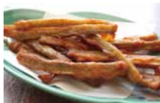
Hot root vegetables