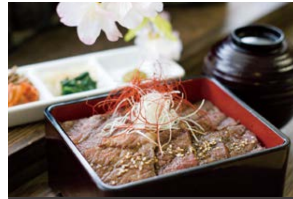
牛カルビの焼肉重