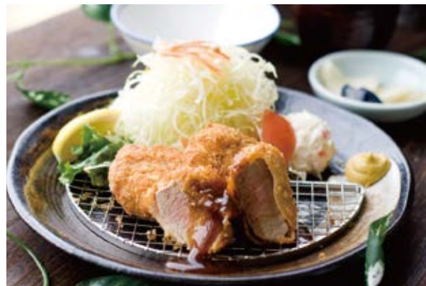
特選豚のヒレカツ膳