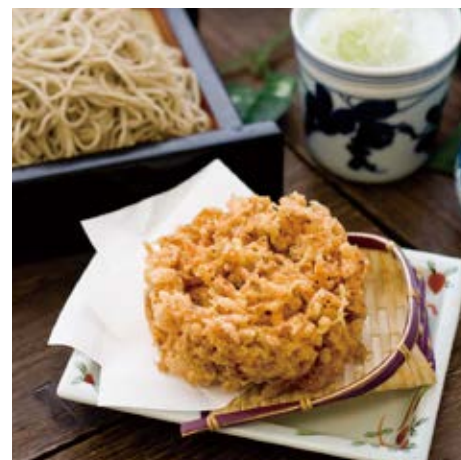
桜海老のかき揚げ 蕎麦orうどん