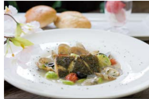
鱈と春野菜の アクアパッツァ