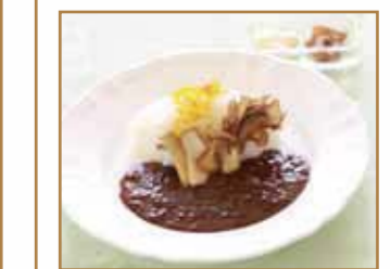
キノコと挽肉のカレー

MEMBER'S Lunch Menu *ご注文は太平洋クラブ・アソシエイツ会員様に 限らせていただきます