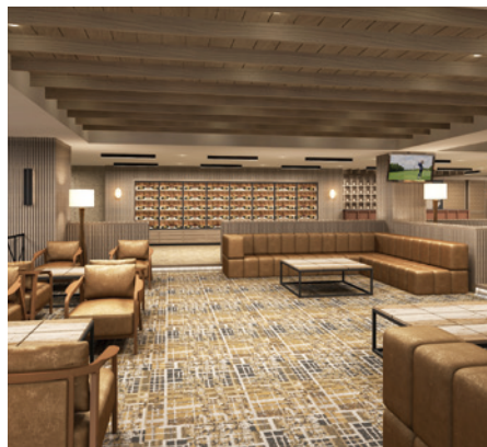
レストランにはラウンジとワインセラーを完備