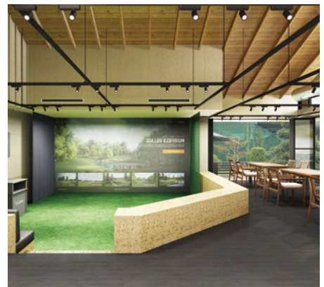
新設のスターターズハウスにはTrackManを完備