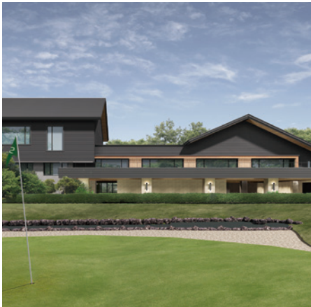
クラブハウス外観イメージ