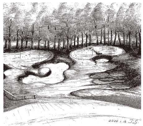
新設するアプローチ練習場のスケッチ

つきましては、この生まれ変わった「太平洋クラブ八千代コース」のメディア視察会を、プレオープン前の3月31日(火)に企画させていただきます。視察プレーの後に記者会見を予定しております。またプレー終了後には、ランチ試食会も予定しております。