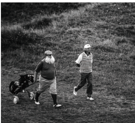
名門コースを彷彿とさせる手引きカートスタイル